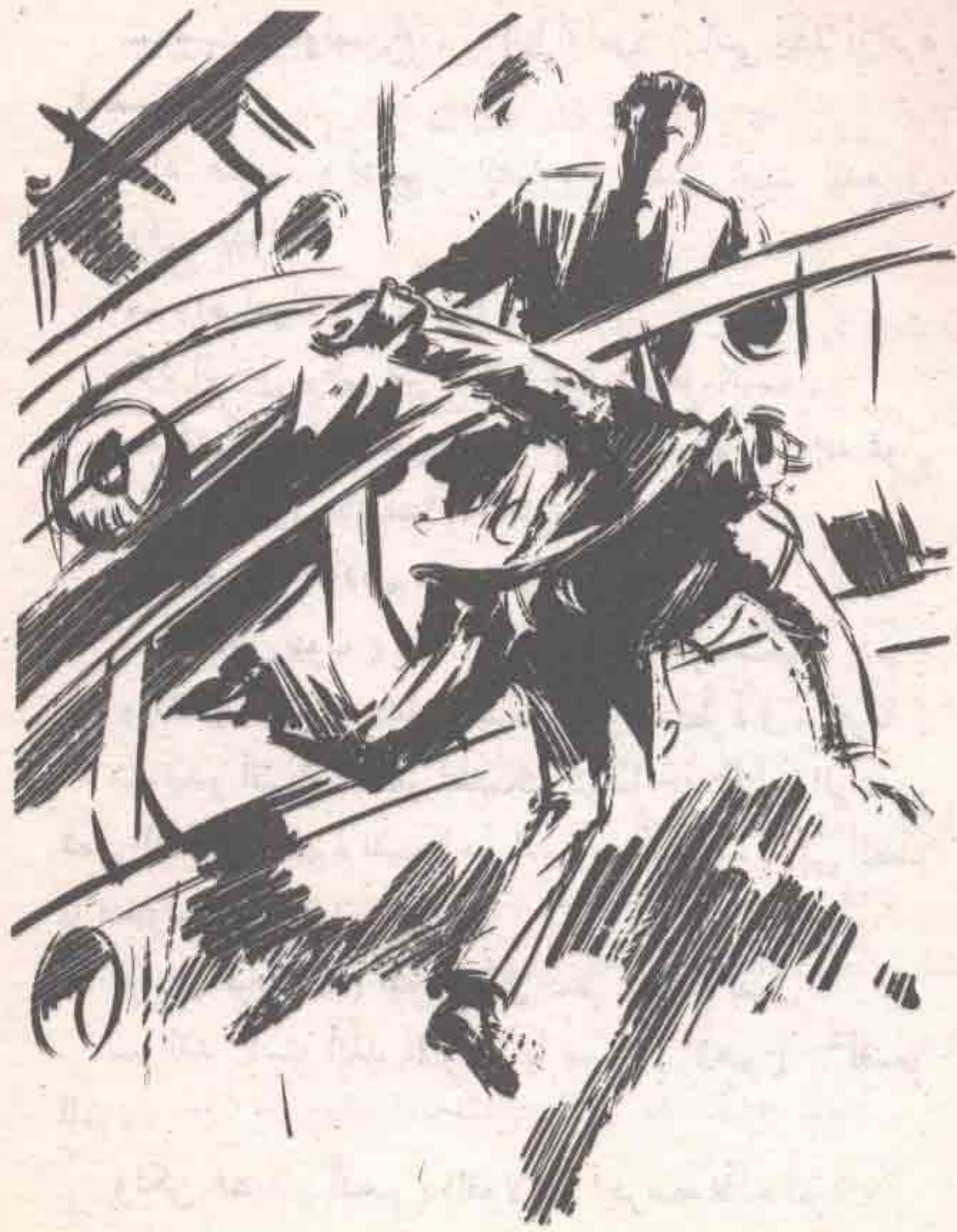
كاد يصرخ حينما سبح جسمه في الفراغ ، خارج السفينة ، ولكن هبوطه توقّف بغتة ، حينما أمسكت به ذراع كالفولاذ ..

( أدهم ) ، ولكن الخنجر هوى في الفراغ ، حينما قفز ( أدهم ) جانبا ، ودار على ساق واحدة ، وركل بالأخرى وجه ( فريدون ) ، الذي اختل توازنه ، وترنّح ، وسقط الخنجر من قبضته ، قبل أن يصطدم بحاجز السفينة ، ويصارع الهواء بذراعيه في رعب ، ثم يهوى إلى البحر ..